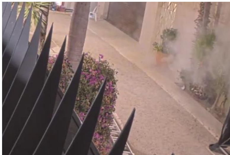
85. לגבי הנור שנפל בחצר הבית, מתוך סרטון הווידאו שהציגה המאשימה ניתן לראות שלאחר שהנור כבה, לא נותרו סימנים.