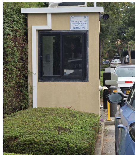
84. ניתן לראות בתמונות חריכה קלה של עלים בשיח. קיר הביתן נותר נקי וללא סימנים.